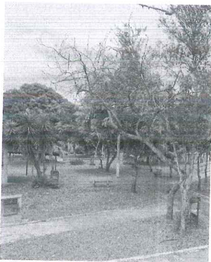
Figura 1: Espécime morto já autorizado.

Diante disso, tratando-se de área pública, estes Técnicos recomendam o desmorte das 02 (duas) árvores mortas, supressão da leucena e poda de elevação de copa nos demais indivíduos arbóreos. Para tanto, encaminhamos o presente Relatório Técnico, bem como respectiva autorização de supressão e desmorte de árvores para a Secretaria de Serviços Urbanos e Obras (SESURB) para conhecimento e execução dos manejos.