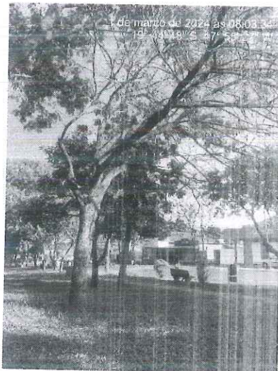
Figura 2: Espécime morto. Fonte: SEMAM, 2024.