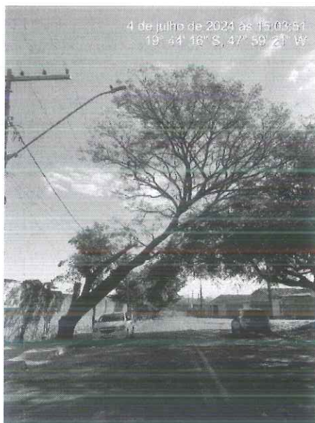
Figura 1: Vista do tamboril apresentado severa inclinação para a via.

Diante do exposto, e de conformidade com os princípios da prevenção e precaução ambientais, recomendamos pela supressão do tamboril, a fim de evitar quaisquer danos à transeuntes, imóveis e veículos. Para isso, encaminhamos o presente relatório técnico, bem como autorização para supressão e destoca de árvores para a Secretaria de Serviços Urbanos e Obras, para conhecimento e execução do manejo.