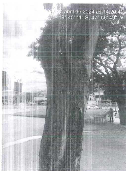
Figura 1: Vista do espécime com destaque para os comprometimentos.