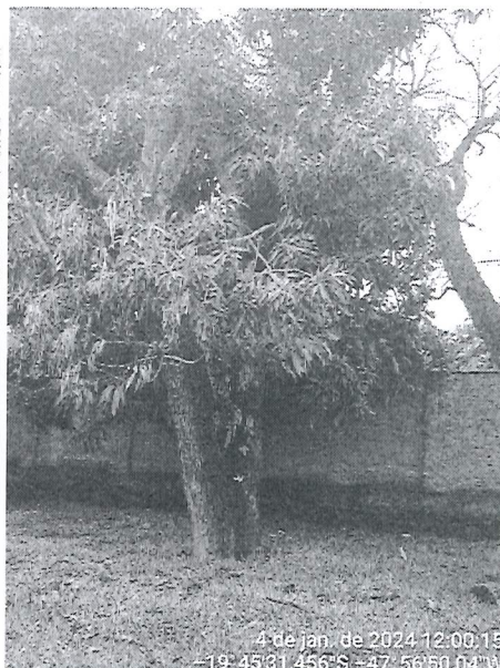
Imagens do espécime morto.