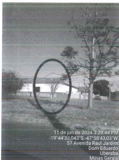
Figura 1: Vista do espécime na rotatória.

Diante do exposto, recomendamos pelo desmonte do espécime, a fim de evitar danos a transeuntes e veículos que circulam na via. Para isso, encaminhamos o presente Relatório Técnico, bem como autorização de supressão para a Secretaria de Serviços Urbanos e Obras para execução do manejo.