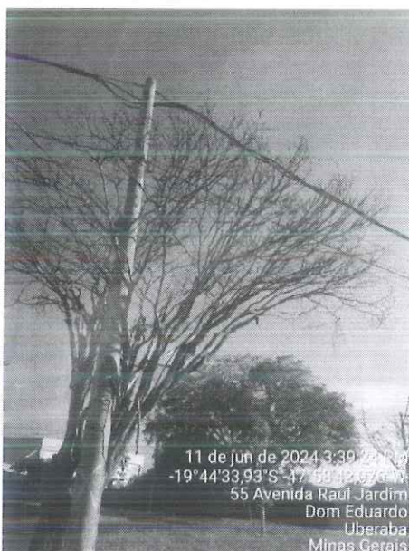
Figura 2: Detalhe do conflito com a rede.