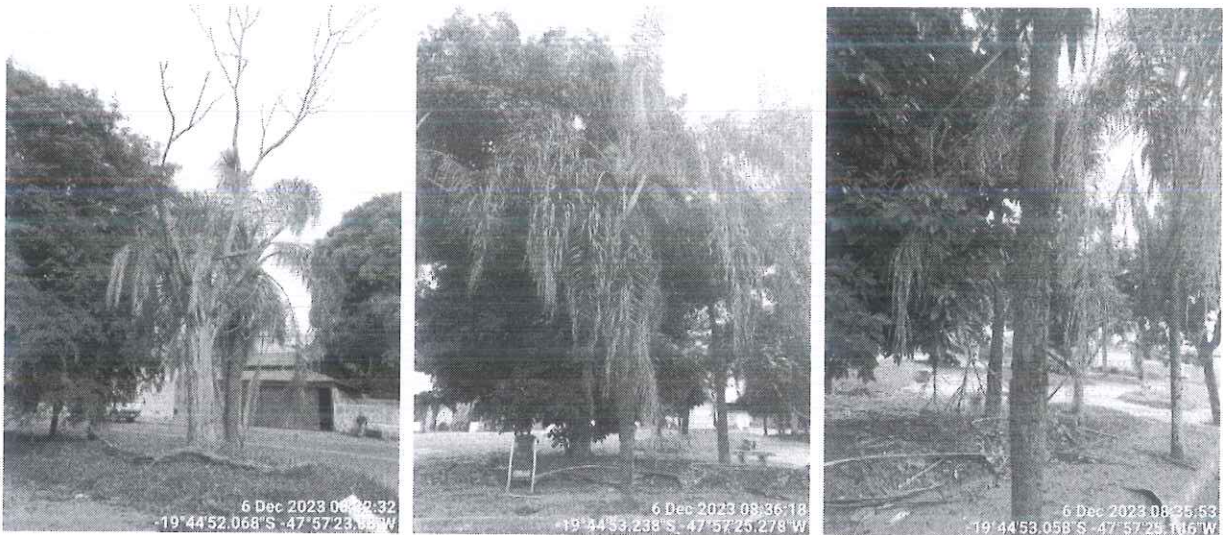
Figura 1: Vista dos espécimes a serem suprimidos: espécime morto e palmeira-jerivá.

Diante do exposto e considerando o risco potencial de queda dos espécimes, recomendamos o desmonte do indivíduo morto e a supressão do jerivá e encaminhamos o presente expediente para a Secretaria de Serviços Urbanos e Obras para conhecimento e execução.