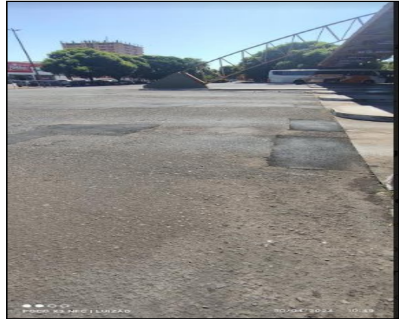
Todos os burados do pátio, fora concertados