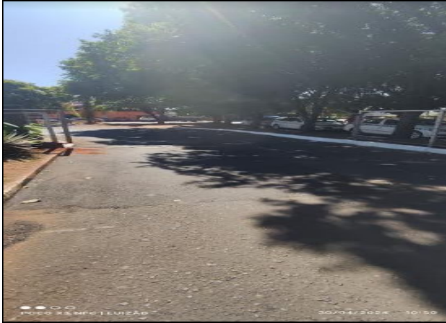
Pátio de rolagem dos ônibus em 30/4/2024