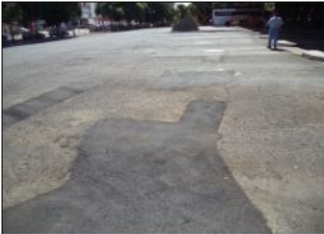
Pátio com todos os buracos recuperados 30/4/24