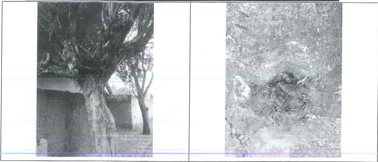
Figura 2 – Imagem dos espécimes – Fonte: SEMAM 2024