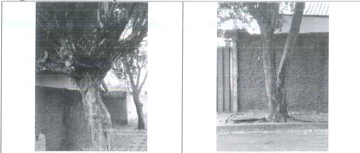
Figura 1 – Imagem dos espécimes – Fonte: SEMAM 2024