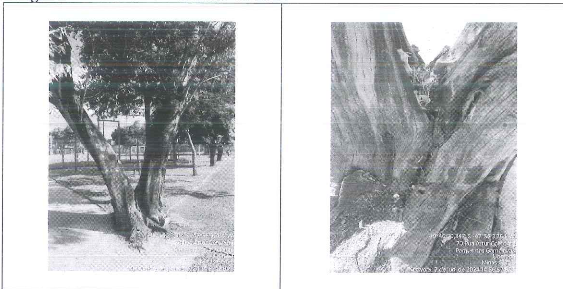
Figura 1 – Imagens do espécime