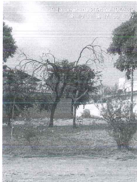
Figura 1: Espécimes mortos alocados em área pública.

Diante disso, encaminhamos o presente Relatório Técnico, bem como a respectiva autorização de desmonte para a Secretaria de Serviços Urbanos e Obras para execução do manejo.