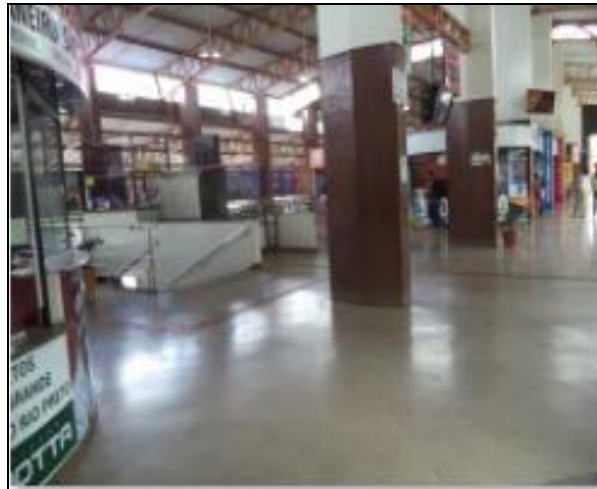
Saguão superior limpo e bem conservado