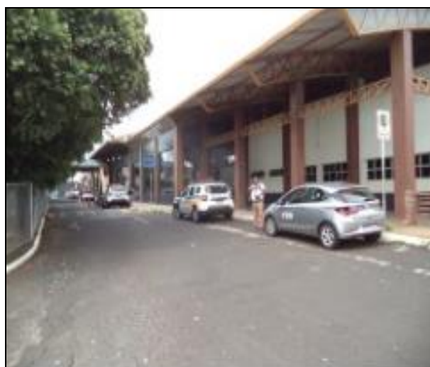
Duas viaturas da Polícia Militar no local