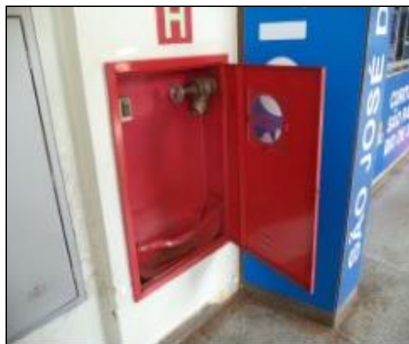
Hidrante sem as mangueiras necessárias