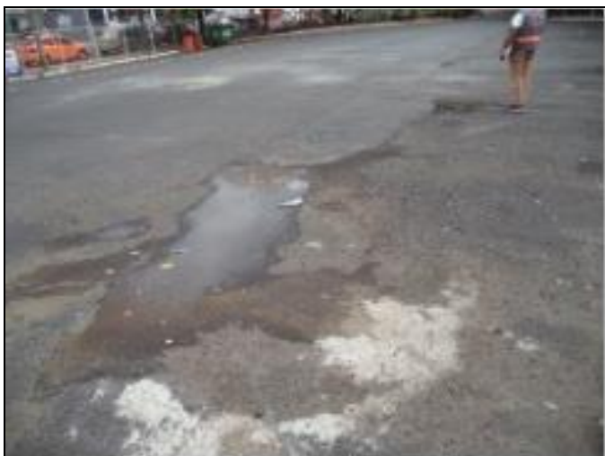
Buracos em pátio de manobra de ônibus 29/12