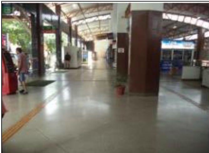
Saguão superior limpo e bem conservado 29/12