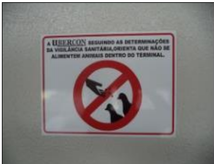
Placa indicativa, proibição de alimentação pombos