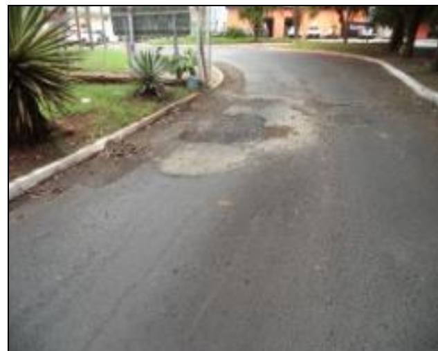
Novos buracos saída dos ônibus em 29/12/23