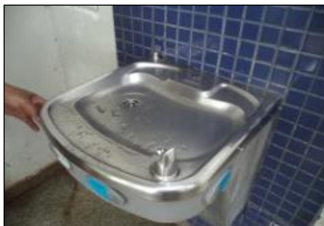
Bebedouro sem torneira, entrada taxistas 29/12