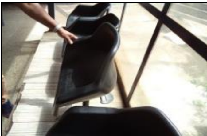
Banco quebrado na área dos taxistas em 29/12/23