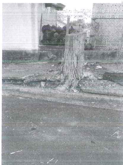
Figura 1: Vista do toco.

Diante do exposto, a fim de evitar quaisquer danos à transeuntes e veículos que circulam na via, encaminhamos o presente Relatório Técnico, bem como a respectiva autorização de destoca de árvores para a Secretaria de Serviços Urbanos e Obras para conhecimento e execução do manejo.