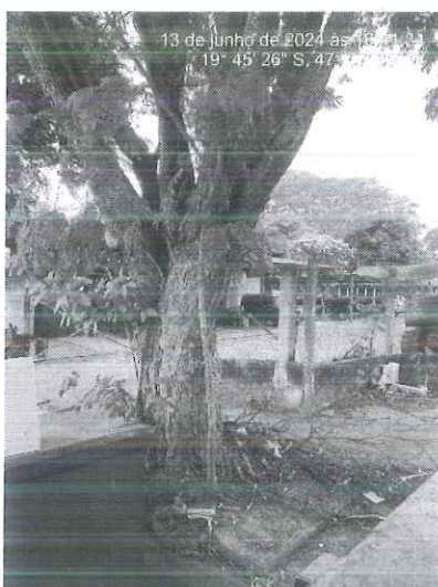
Figura 2: Vista. Fonte: SEMAM, 2024.