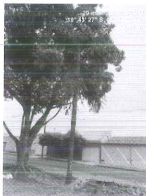
Figura 2 – Vista da palmeira cariota.