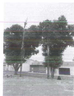
Figura 3 – Vista da palmeira cariota.