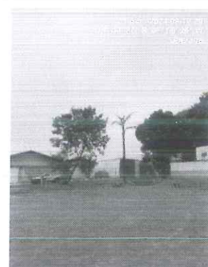
Figura 6 – Vista da palmeira cariota.

Diante disso, encaminhamos o presente Relatório Técnico, bem como autorização para supressão das oito palmeiras cariotas para a Secretaria de Serviços Urbanos e Obras para conhecimento e execução do manejo.