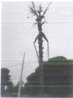
Figura 1 – Vista da palmeira cariota.

No momento da vistoria, foi possível constatar que na verdade tratam-se de 08 (oito) espécies, todas em final de ciclo biológico, considerando ainda que o espécime em tela possui em seus frutos cristais de oxalato de cálcio que causam grande irritação a pele quando manuseados, e cujo plantio em áreas públicas não é recomendado, conforme o que estabelece a Lei Complementar nº 389/2008 (Código de Meio Ambiente).