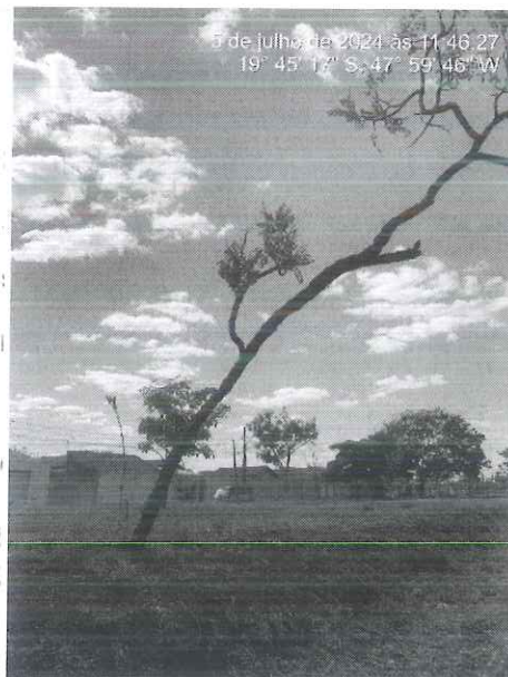
Figura 1: Vista do espécime alocado no canteiro central da via.

Diante do exposto, considerando os princípios da prevenção e precaução ambientais, bem como o intenso fluxo de veículos, com danos à transeuntes e veículos, recomendamos pela supressão do espécime. Para isso, encaminhamos o presente Relatório Técnico, bem como a respectiva autorização para supressão e destoca de árvores para a Secretaria de Serviços Urbanos e Obras para conhecimento e execução do manejo.