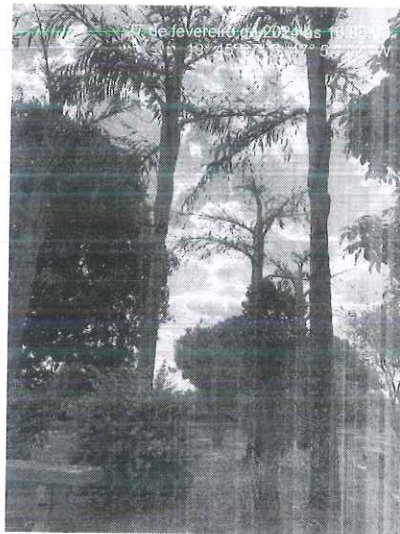
Figura 1: Vista das palmeiras cariotas alocadas em praça pública.

Diante disso, encaminhamos o presente Relatório Técnico, bem como autorização para supressão das cinco palmeiras cariotas para a Secretaria de Serviços Urbanos e Obras para conhecimento e execução do manejo.