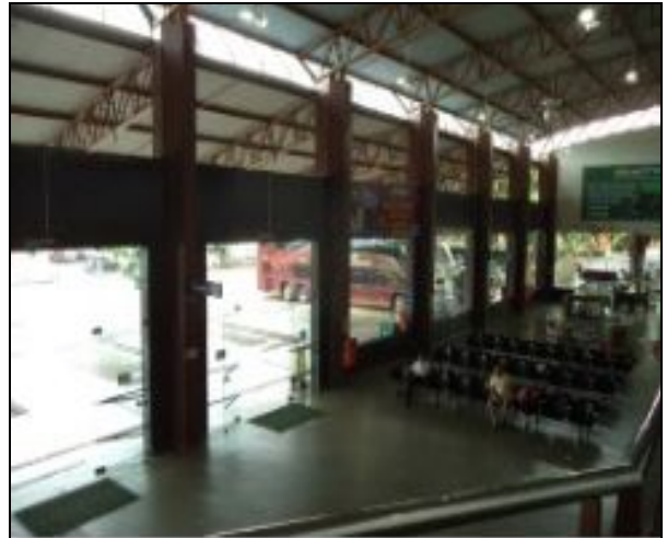
Saguão de embarque bem conservado