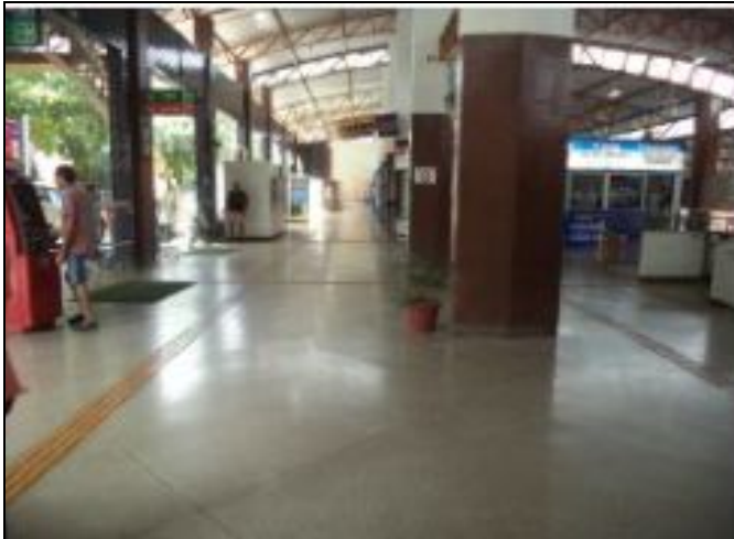
Saguão superior limpo e conservado 31/1/24