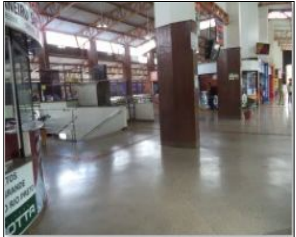
Saguão superior limpo e bem conservado