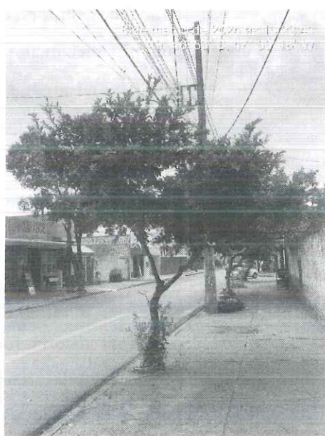
Figura 2: Vista da pata-de-vaca e dos limoeiros alocados na calçada na instituição.