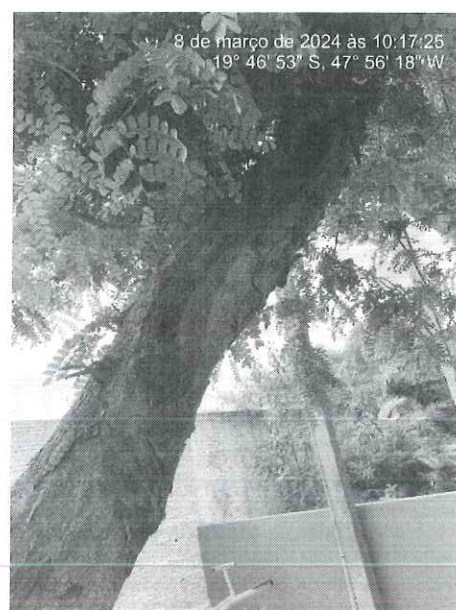
Figura 1: Vista do pau-brasil alocado na área do parquinho com destaque para os comprometimentos e os galhos caídos.