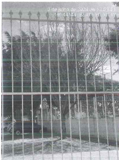
Figura 1: Vista do espécime morto alocado no estacionamento da Paróquia.

Diante do exposto, encaminhamos o presente Relatório Técnico, bem como respectiva autorização de desmonte para a Secretaria de Serviços Urbanos e Obras para execução do manejo.