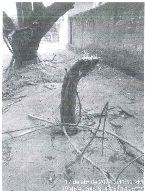
Figura 2: Vista do toco não identificado.