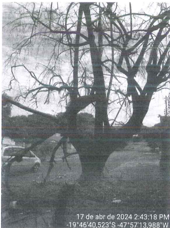
Figura 1: Vista do espécime morto não identificado.

Diante do exposto, recomendamos pelo desmonte do espécime morto e destoca do espécime ao lado, a fim de evitar quaisquer danos à transeuntes e veículos que circulam na via. Para isso, encaminhamos o presente Relatório Técnico, bem como autorização de desmonte e destoca para a Secretaria de Serviços Urbanos e Obras para execução do manejo.