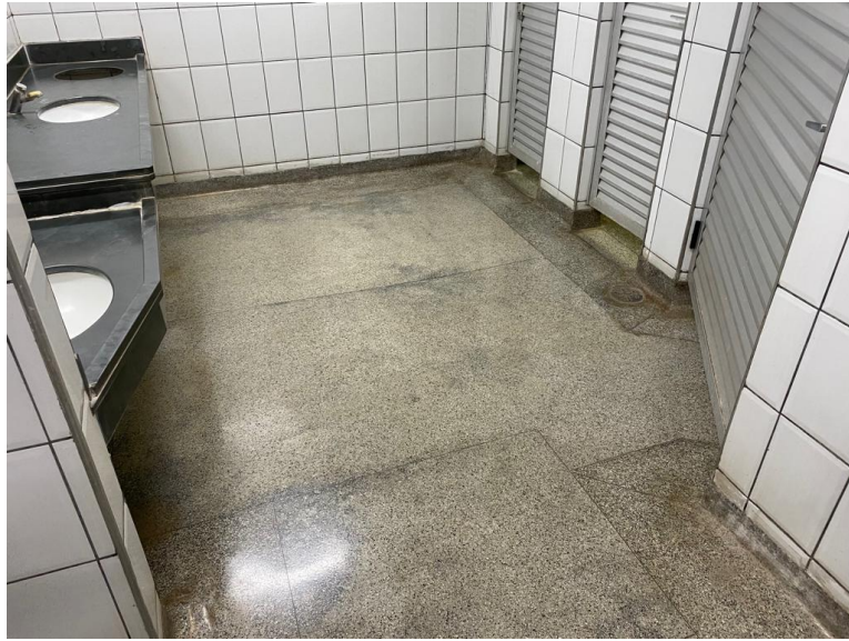
➤ Banheiro masculino comum: