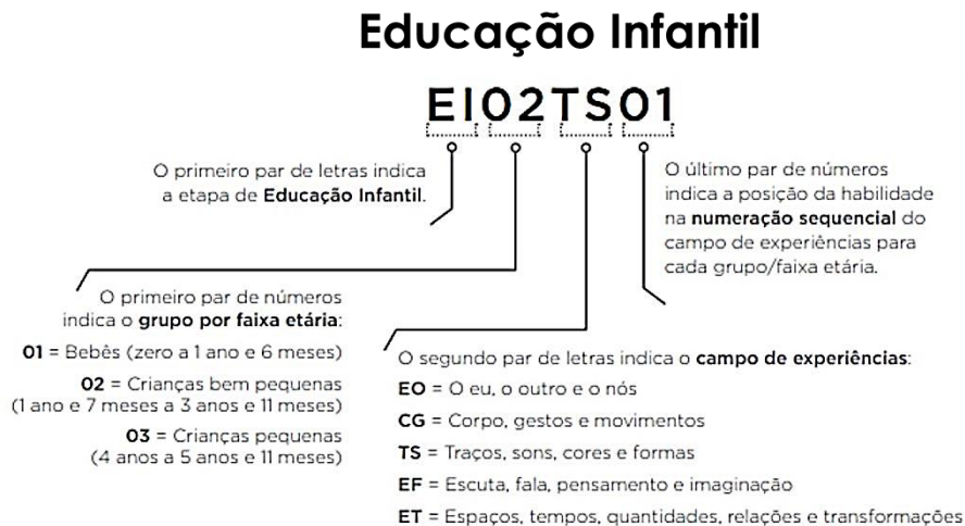
Figura 1 - Estrutura de Objetivos de Aprendizagem e Habilidades

Para se realizar a leitura dos organizadores curriculares da Educação Infantil (quadros referentes aos Campos de Experiências, Direitos de Aprendizagem e os Objetivos de Aprendizagem), é necessário entender a estrutura prevista na BNCC (BRASIL, 2017) e no Currículo Referência de Minas Gerais (2019), e a significação dos códigos alfanuméricos como abaixo: