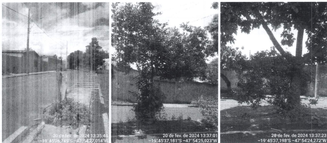
Da esquerda para a direita: destoca e limoeiros a serem suprimidos.