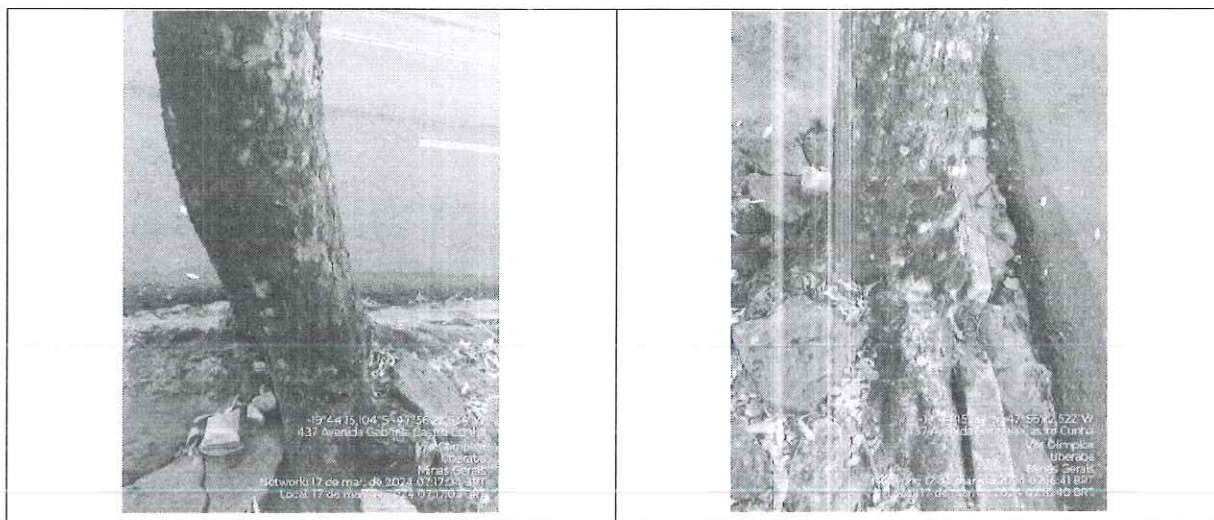
Figura 2 – Inclinação do fuste e conflito radicular com rua