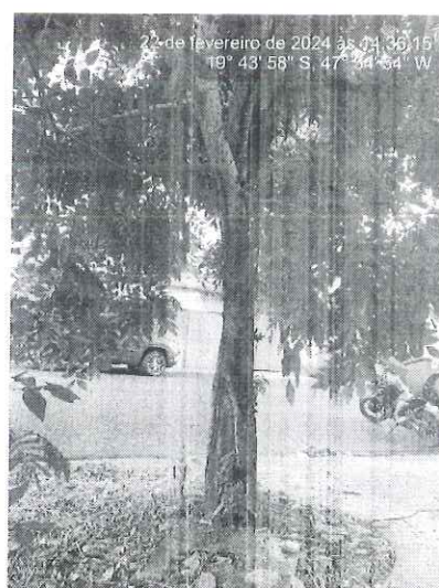
Figura 1: Vista das chuvas-de-ouro com destaque para a necrose no fuste.