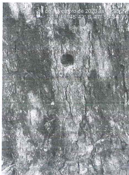
Figura 2 – Perfuração no coleto.