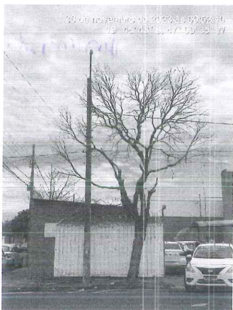
Figura 1: Oitizeiro morto.

Durante vistoria de rotina, no dia 30/11/2023, foi possível observar 01 (um) espécime morto, identificado como sendo 01 (um) oitizeiro ( Licania tomentosa ) após consulta no Google maps , localizado na calçada do imóvel, com perfuração no coleto, conforme figura abaixo.