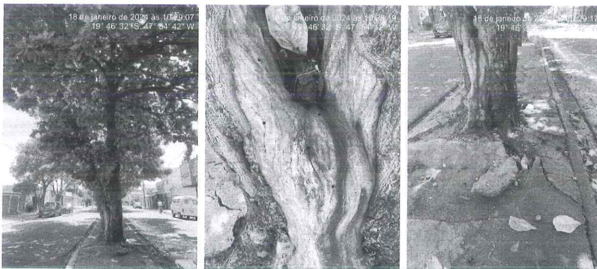
Figura 1: Sete-copas comprometida por processo de necrose e elevação do canteiro.

Diante disso, a fim de evitar quaisquer danos à transeuntes e veículos que circulam na via, encaminhamos o presente Relatório Técnico, bem como a respectiva autorização de supressão de árvore e destoca para a Secretaria de Serviços Urbanos e Obras para execução do manejo.