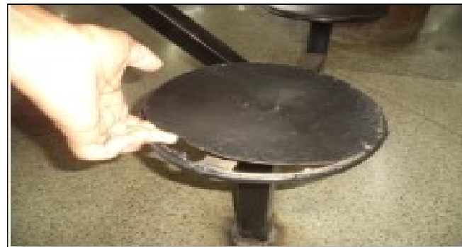
Necessário reparo banco mesa próximo salão C.