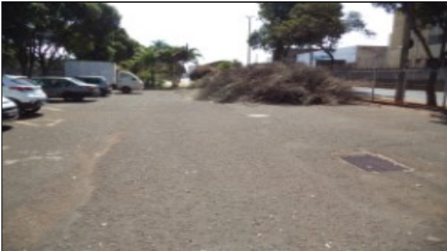
Pátio com matérias a serem retiradas 30/7/2024