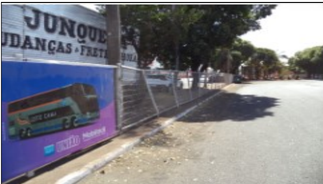
Alambrado será consertado em até 5(cinco) dias