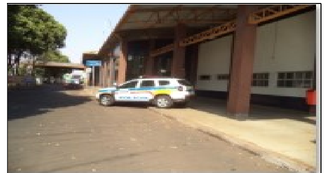
Policciamento na data da fiscalização 4/9/24