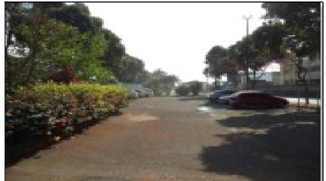
Pátio limpo na fiscalização de 4/9/2024