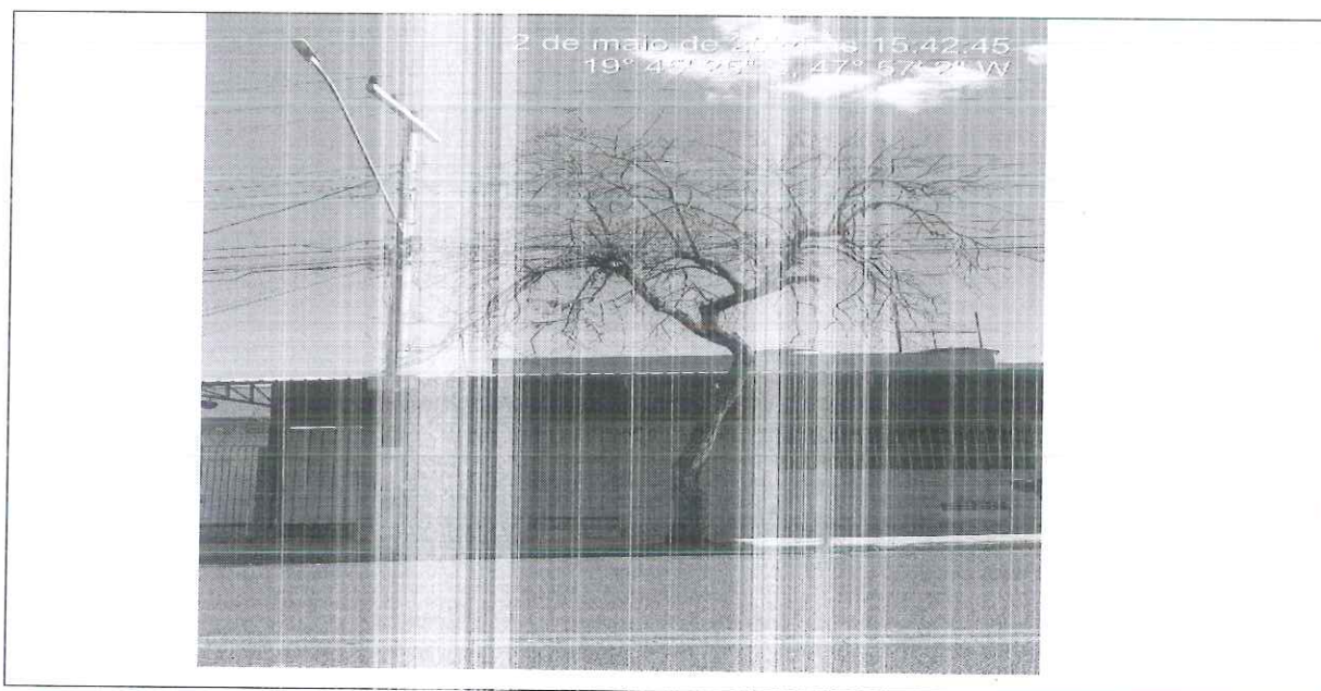
Figura 1 – Imagem do espécime