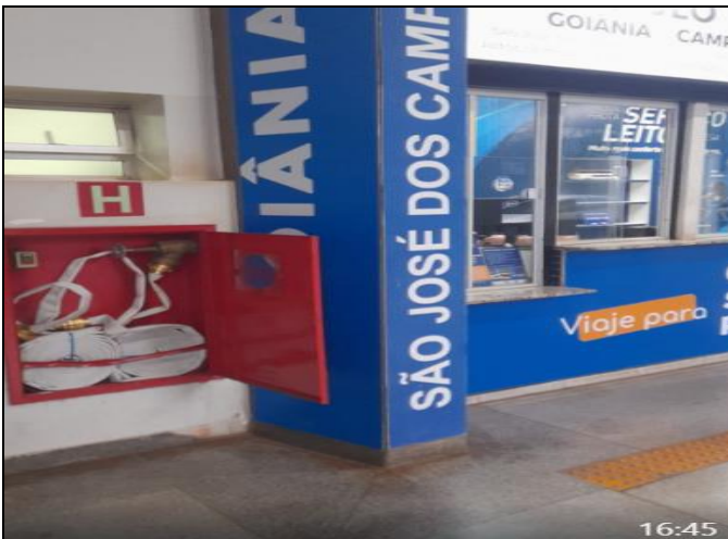
Reposição das mangueiras roubadas em 27/3/24