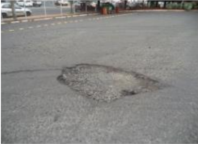
Pátio de rolagem dos ônibus em 27/3/2024