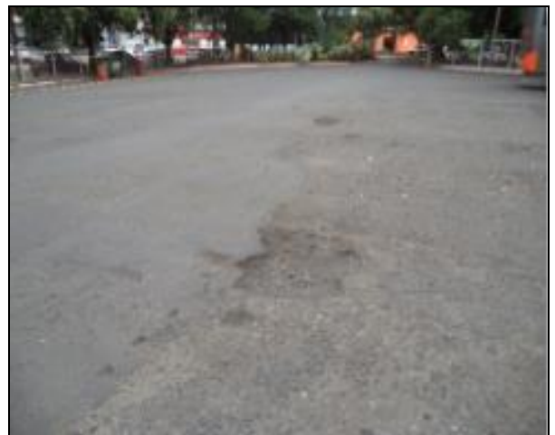
Alguns buracos a serem reparados