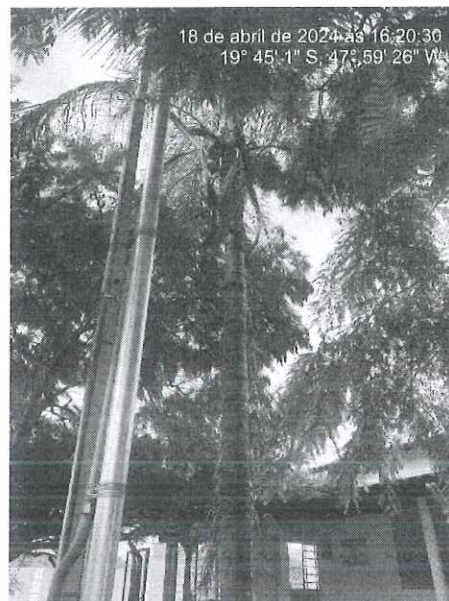
Figura 1: Vista dos espécimes.