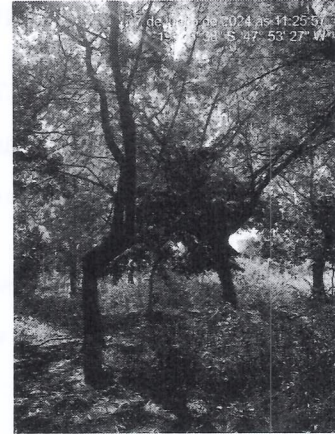
Figura 2: Vista dos espécimes na área.