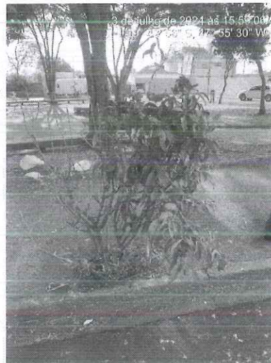
Figura 3: Vista dos espécimes alocados na Praça Adélia Maluf.