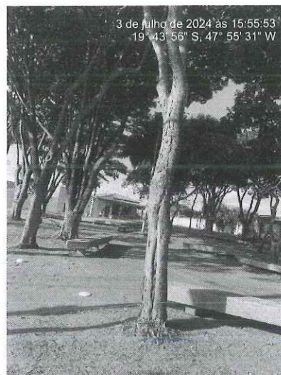
Figura 2: Vista dos espécimes alocados na Praça Adélia Maluf.