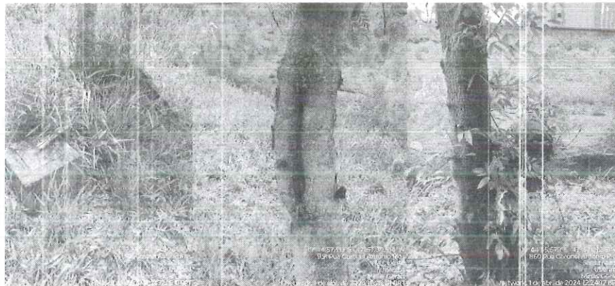
Figura 2 – Imagens das espécimes na área interna