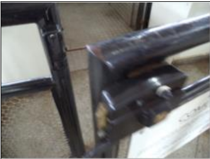
Trava de entrada do elevador, concertada em 30/11