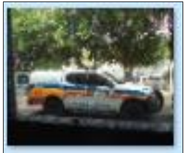
Viatura Policia Militar nas dependências