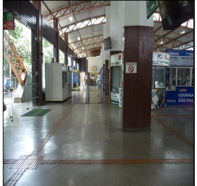
Saguão superior limpo e bem conservado